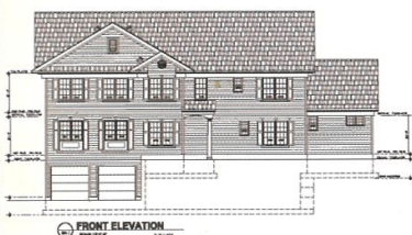
中心正面之整修藍圖